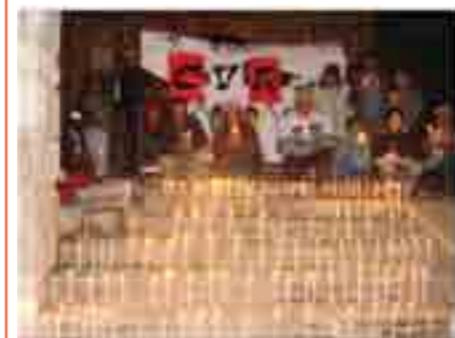
250 velas en memoria de las víctimas de la violencia terrorista de Coporaque, Cusco

Arequipa: Taller de Capacitación a Periodistas sobre el Informe de la CVR; Taller de capacitación denominado “Generando Ciudadanía y Cultura de Paz”; Muestra Fotográfica “Yuyanapaq” (Para Recordar); “Festival Cultural por la Paz” con teatro, mimo, música y declamaciones; Plantón en la puerta de la Corte Superior de Justicia de Arequipa.