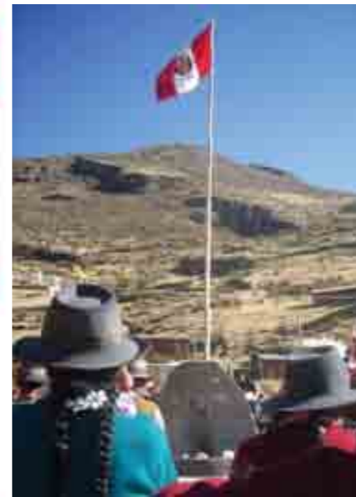
Inauguración del Ojo que llora. Comunidad de Llinque, distrito de Toraya, Apurímac.