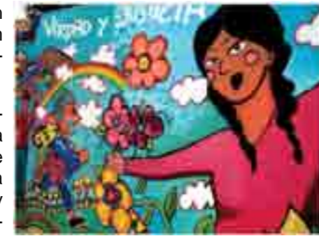
Muralización por artistas jóvenes en el Ovalo de la Paz de El Agustino. Lima

Pasco: Taller de formación y capacitación de docentes y estudiantes universitarios: Conclusiones y valores de la CVR en el plan curricular educativo – estrategias y metodología; Taller de información a periodistas; Implementación de las conclusiones y recomendaciones del Informe Final de la CVR; Eucaristía “Por la reconciliación con justicia y dignidad para todos”; Seminario y Feria Exposición de fotografías CVR+5; Movilización de representantes de instituciones educativas, públicas y sociales hacia el Obelisco de la Paz y Memoria a las Víctimas; Festival de pasacalles, coreografías y premiación a las instituciones educativas presentes; Caminata Ciudadana.