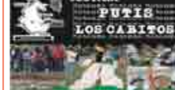
Acto cultural en memoria de los asesinatos en Pulis y Cabito (1983-1985).