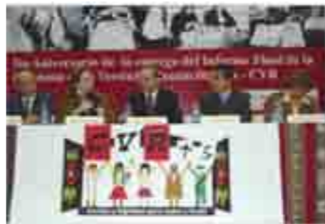
Panel Forum CVR+5. Participó Yehude Simon, presidente Regional Lambayeque.